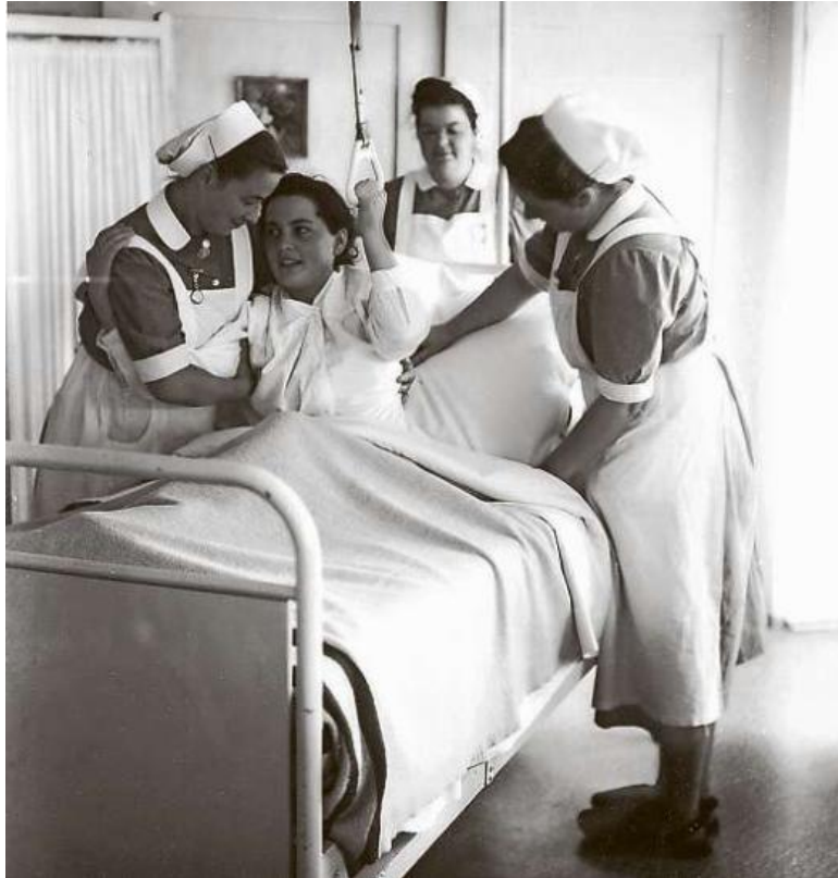
Seit anderthalb Jahrhunderten spielt das Spital in Ilanz eine zentrale Rolle in der Gesundheitsversorgung der Surselva.

Dieser wechselhaften Geschichte will das Spital zu seinem 150-Jahr-Jubiläum gedenken.