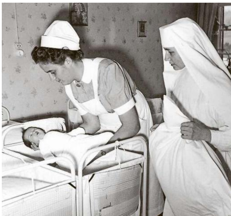
Die Kongregation der Ilanzer Dominikanerinnen spielte über Jahrzehnte eine grosse Rolle in der Spitalpflege und in der Pflegeausbildung.

Manfred Veraguth: «150 onns Spital regional Surselva. Vom privaten Hospitale zur Regionalspital Surselva AG 1868–2018.» 120 Seiten. 80 Abbildungen. 25 Franken. Erhältlich in der Spitalcafeteria ab 2. März.