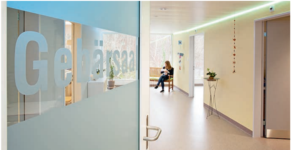
Neu Gebärdabteilung seit September 2017