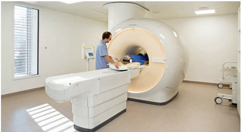
Neu seit Dezember 2017: Magnetresonanztomographie